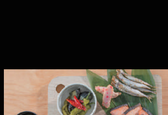
たこ焼き含む温製料理