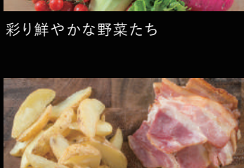
フライドポテト/ベーコン/串カツ