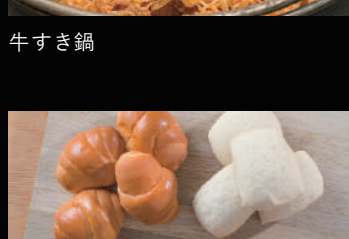
パンの盛り合わせ