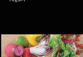
彩り鮮やかな野菜たち