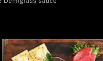
前菜の盛り合わせ