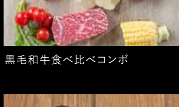
焼きチーズカレー