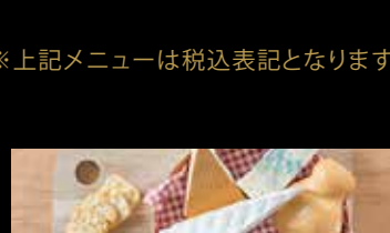
お好みチーズ盛り合わせ