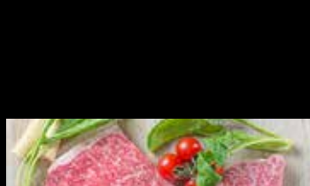
黒毛和牛食べ比べコンボ