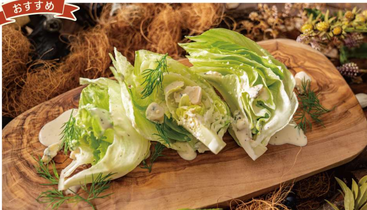
ウエッジカットレタスサラダ ゴルゴンゾーラドレッシング

Wedge Cut Lettuce Salad with Gorgonzola Dressing