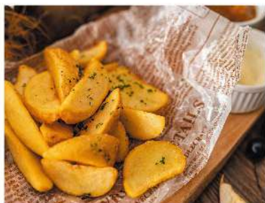
フライドポテト(ガーリック&ハーブ) ¥300 French Fries (Garlic & Herb Salt)