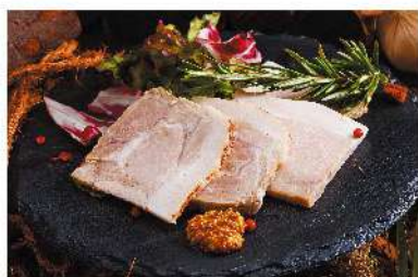
燻製ローストポーク ¥500