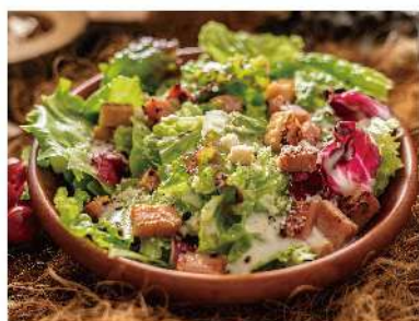
シーザーサラダグリルドベーコン ¥550 Grilled Bacon Caesar Salad