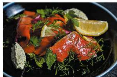
スモークサーモン ディルクリームチーズ ¥1,000