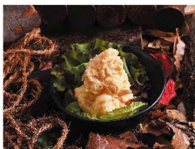
燻製玉子とポテトサラダ ¥500 Smoked egg potato salad