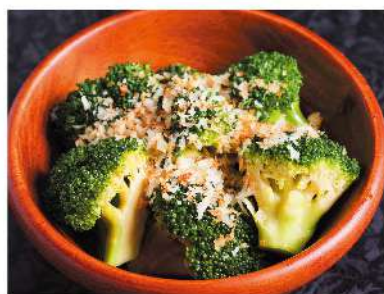
ブロッコリーサラダ ¥550 Broccoli Salad