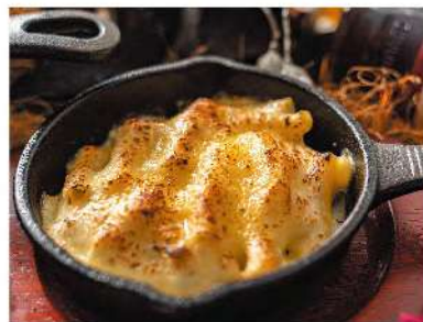
マカロニ & チーズ ¥500 Macaroni & Cheese