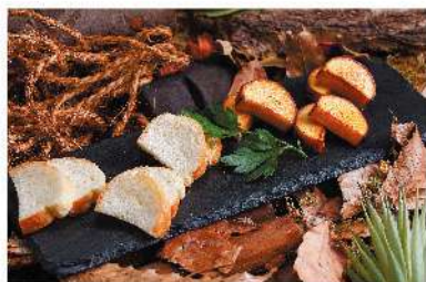
バイクドスモークチーズ ¥550