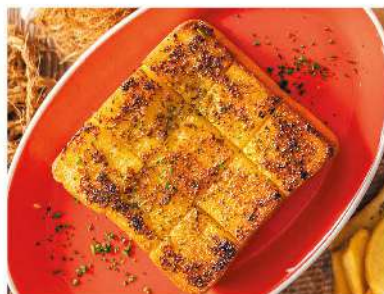
ガーリックトースト ¥300 Garlic Toast