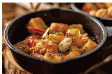
ガーリックシュリンプ ¥1,100