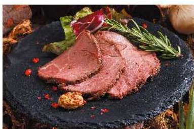
燻製ローストビーフ ¥600