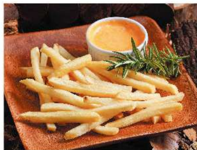
CHEDDARチーズポテト ¥450 cheddar cheese potatoes