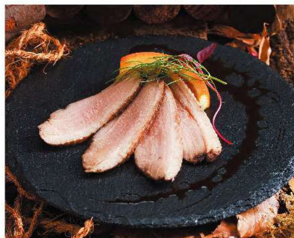
赤ワイン風味の燻製鴨 ¥600

●おすすめワイン品種 シャルドネス / パークリング(白) スパークリング(ロゼ) / シラース