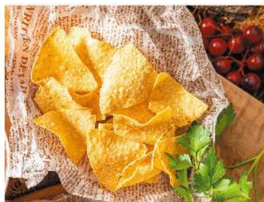
サルサヒメカーナトルティヤチップス ¥500 Mexican Salsa with Tortilla Chips