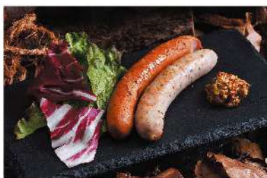
スモークソーセージ ¥500