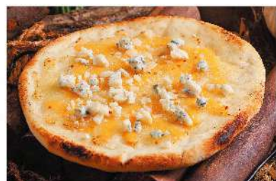
スモークピッツァ ¥1,000