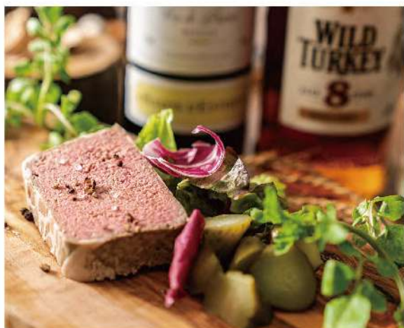
神戸ポーク100%パテドカンパーニュ ¥800