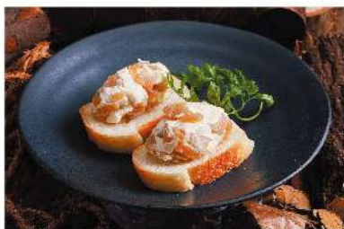
燻製奈良漬けとクリームチーズ ¥500